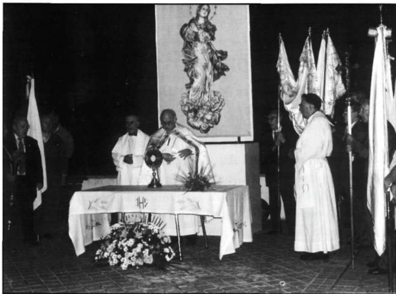
Desde este altar el Señor bendijo a los campos y a la ciudad.

coches, iniciamos la procesión eucarística que haría estación en un sencillo, pero bonito altar, y desde el que se dio la bendición con el Santísimo a la ciudad, a los campos y a cuantos, durmiendo o velando, la quisieron recibir. El regreso también fue silencioso, el recogimiento total. A la entrada al templo, toda la emoción contenida saltó en un canto jubiloso: "Dios está aquí ..." "De rodillas, Señor ante el Sagrario...".