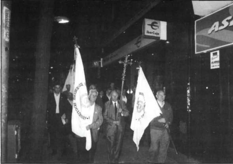
Se inicia la procesión de banderas desde el colegio de María Cristina