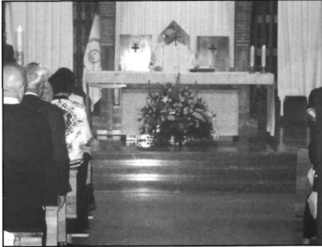
«...En el templo parroquial tuvo lugar la vigilia».

Después de un breve descanso y compartido el ágape fraterno en el templo parroquial tuvo lugar la vigilia, solemnizada por el Coro de Adoradores "Tomás Luis de Victoria", que ha participado en todos los encuentros celebrados.