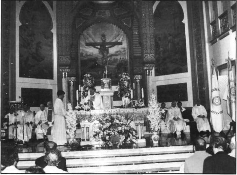
La misa estuvo presidida por el Vicario de zona y concelebrada por varios directores espirituales.