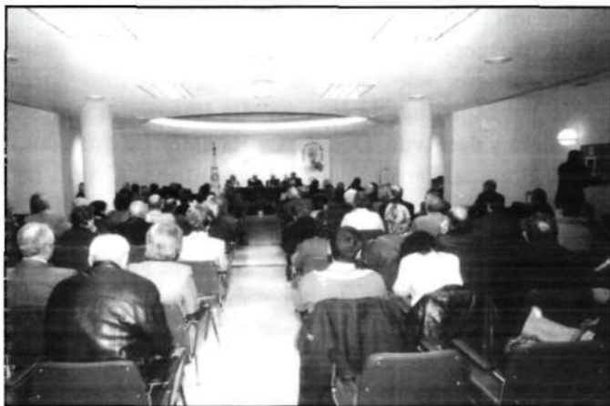
«... Convocados por Jesucristo Eucaristía se reunieron en un alto número...»